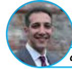
di Igor Marcolongo

D omenica 22 settembre si è tenuta a Torreglia la prima edizione di Torreglia Running Day, evento sportivo di beneficenza organizzato dal Comune di Torreglia con la sponsorizzazione di InfoCert SpA e di molte aziende locali, composto da una marcia di 6, 12 e 10 km sui sentieri intorno a Torreglia e una corsa agonistica amatoriale di 10 km su percorso stradale. Torreglia Running Day si è inserita nel circuito nazionale di corse "Walk of Life", organizzata dalla Fondazione Telethon a cui è stato destinato il ricavato dalle quote d'iscrizione, pari a € 3.185,44, per supportare la ricerca sulle malattie genetiche. L'evento è stato un successo, con circa 800 iscritti e ha coniugato lo sport con la solidarietà, senza dimenticare la promozione dei nostri sentieri e del territorio. Nel pacco gara consegnato ai partecipanti, donato dalla Fondazione Telethon, era presente un buono sconto per il pranzo presso uno dei ristoranti aderenti all'associazione Tavole Tauriliane, nonché uno sconto sul biglietto di ingresso alla Villa dei Vescovi. "Siamo davvero felici che la nostra proposta di una marcia di beneficenza