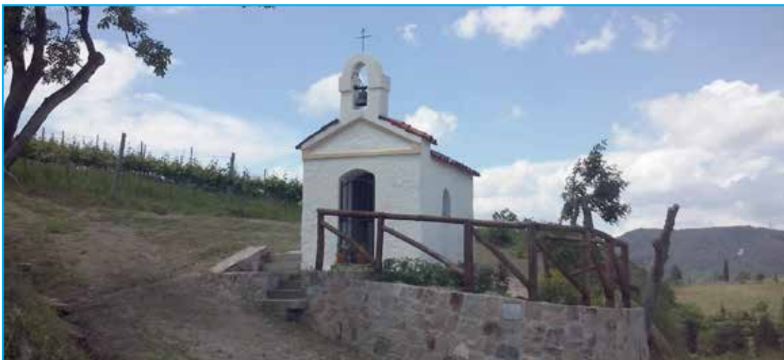
La chiesetta sulle Terre Bianche che è stata ristrutturata qualche anno fa dai volontari del Gruppo Alpini